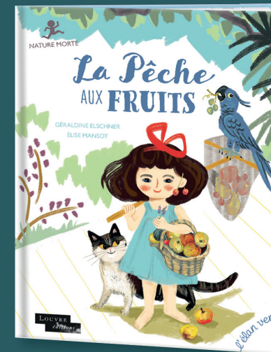
La Pêche aux fruits Géraldine Elschner, ill. Élise Mansot 36 pages · 25 x 32 cm · 15,90€

Cueillez les albums en bouquet, dévorez les histoires, plongez dans l'art de toutes les manières possibles, rêvez, créez... que ce joli mois de mai ne finisse jamais !