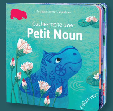
Cache-cache avec Petit Noun Géraldine Elschner, ill. Anja Klaus 14 pages · 19 x 19 cm · 10,90€