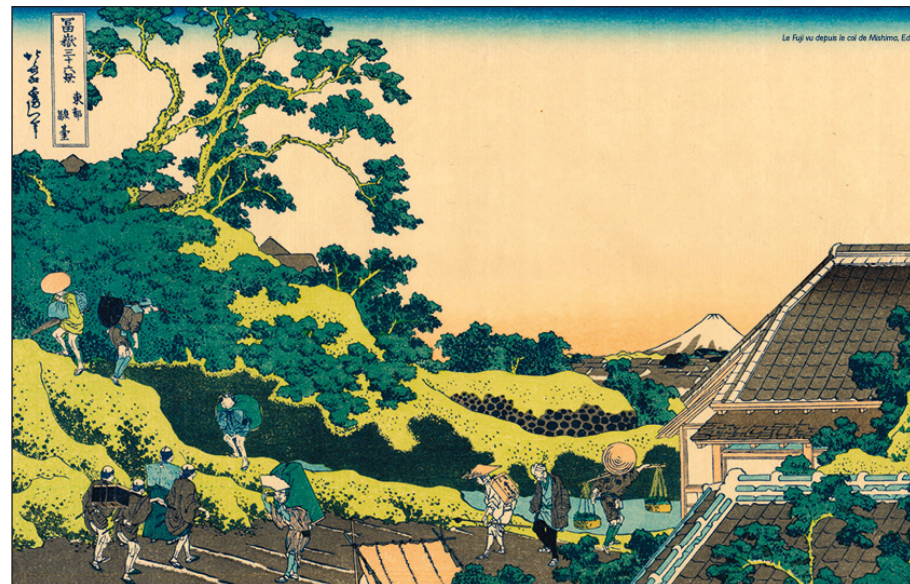
Le Fuji vu depuis le col de Mashima, Edo